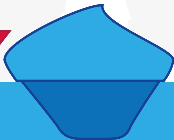
Projekti ar Youthpass