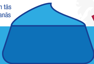
Projekti bez Youthpass

Apslēptais mācīšanās process un rezultāti